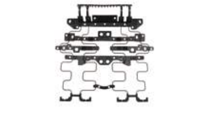
SUSPENSION SUB ASSY