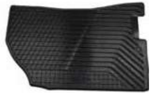
FLOOR MAT FRT LH