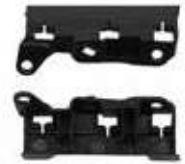
RAIL DR UPR TRIM