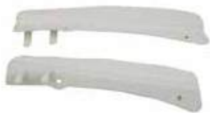
COVER_FR BACK SAB GUIDE