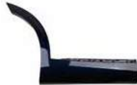
GARNISH RR DR SIDE