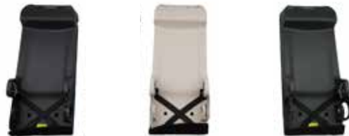
CTR BOARD ASSY-BACK ASSY