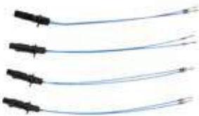
HARNESS UNICK CONNECTOR