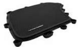
SPEAKER GRILLE (하만카돈)

차량의 도어 하부에 장착되어 차량의 도어 개폐시 점등하는 인테리어 부품.