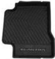
FLOOR MAT RR LH