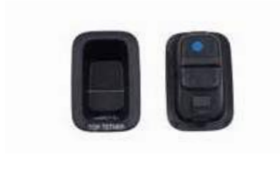
TETHER ANCH GARNISH