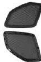
COVER ASSY-W/SPEAKER GRILLE