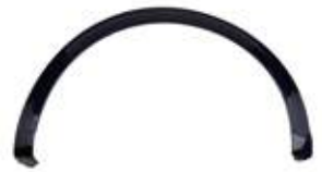
GARNISH FNDR SIDE UPR (STD)