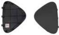
COVER SURROUND S/GRILLE BLANKING