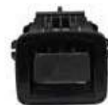
HOUSING ASSY SEAT REMOTE FOLD'S LEVER