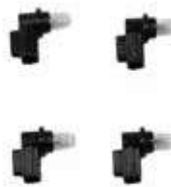
BULB HOLDER ASSY