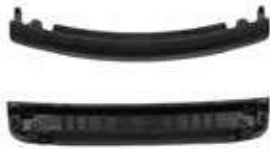
HDL-TAIL GATE GRIP