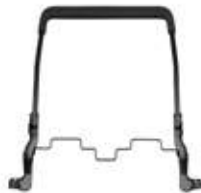
SLIDE LEVER ASSY