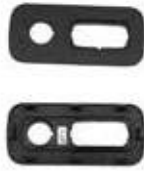
COVER POWER OUTLET