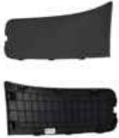
COVER TAIL GATE RR LAMP