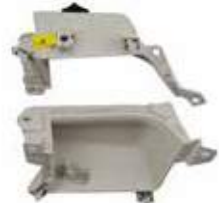
HDL-FRT DR PULL