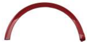
GARNISH FNDR SIDE UPR (SPO)