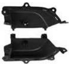
HDL-RR DR PULL