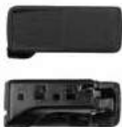
REMOTE FOLD'S LEVER ASSY