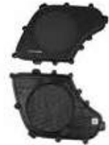
COVER ASSY-W/SPEAKER GRILLE (하만카톤)