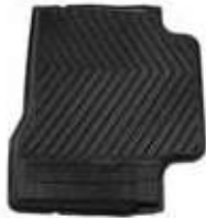
FLOOR MAT RR RH