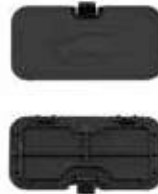
COVER TAIL GATE EMERGENCY HDL