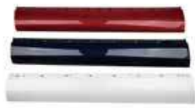
GARNISH FRT DR SIDE

DOOR GARNISH 차량의 외관 또는 내부에 기능이나 특징상 부드러운 곡선형에서 벗어난 부위를 차체와 일체감있고 부드럽게 꾸며주고 손잡이를 감추어 주는 부품