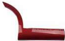
GARNISH RR DR SIDE