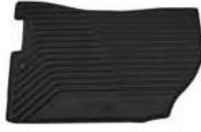
FLOOR MAT FRT RH