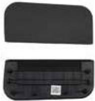
COVER SIDE TRAY